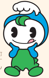
おおい町 マスコットキャラクター うみりん